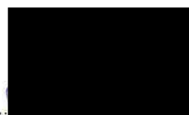
Oldřich Koblížek starosta

OBEČ VRACLAV Vraclav 66 585 42 Vraclav IČO: 00279749