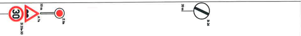
schéma B/4 od 18:00 do 7:00

VAMBERK PRACOVNÍ MÍSTO MAX. 600 M C 4b ÚSTÍ NAD ORLICÍ